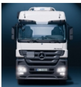
Комплект установки WAECO CoolAir RT880/850S/CoolAir SP-950 Монтажная концепция кондиционеров CoolAir: простой и быстрый монтаж благодаря использованию собственных точек крепления автомобиля.