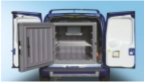
Холодильник WAECO CoolFreeze 850VAN Холодильник WAECO CoolFreeze 850VAN, 850л, охл./нагр.