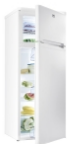
Автохолодильник WAECO CoolMatic HDC-225 Компрессорный холодильник большого объема.

Все установочные комплекты разработаны для фактических моделей автомобилей.