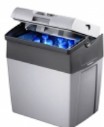
Автохолодильник WAECO CoolFun SC30 AC/DC Автохолодильник Ваесо CoolFun SC30 AC/DC – современное переносное устройство, позволяющее автолюбителям сохранять продукты в надлежащем виде в дороге. Примечательно то, что эта сохранность может выражаться как в охлаждении, так и подогреве. В каких случаях это может пригодиться? Первый вариант позволит довести до дома, купленные в магазине, скоропортящиеся продукты, такие как: мясо, рыба, молоко. Поможет он и при семейных выездах на дачу, природу, устройстве пикников. При этом температура в контейнере может опускаться на 18 градусов ниже по сравнению с окружающей средой.