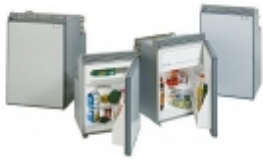
Панель вентиляционная для а/х WAECO CoolMatic MDC 65