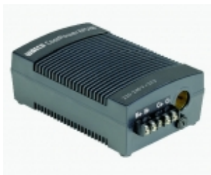
Преобразователь тока WAECO CoolPower EPS-100

Идеален для использования дома, в гостинице, кемпинге.