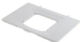
Комплект установки WAECO CoolAir RT880/850S/SP-950 Монтажная концепция кондиционеров CoolAir: простой и быстрый монтаж благодаря использованию собственных точек крепления