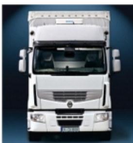
Комплект установки WAECO CoolAir RT880/850S/CoolAir SP-950 Установочный комплект, подходящий для накрывного кондиционера Waeco CoolAir CA 850S/SP-950