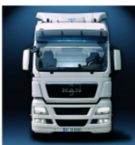
Комплект установки WAECO CoolAir RT 880/850S Монтажная концепция кондиционеров CoolAir: простой и быстрый монтаж благодаря использованию собственных точек крепления автомобиля.