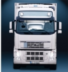
Комплект установки WAECO CoolAir RT880/850S/CoolAir SP-950 Монтажная концепция кондиционеров CoolAir: простой и быстрый монтаж благодаря использованию собственных точек крепления автомобиля.