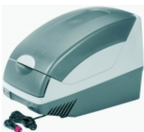
Термоэлектрический автохолодильник WAECO BordBar TB-15

Уникальный дизайн. Холодильник сделан в форме подлокотника. Имеет механизм для крепления на сидение