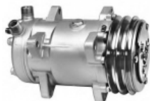
Компрессор WAECO TM 15 Данный компрессор предназначен для холодильника waeco tm 15.