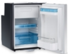
Холодильник для яхт и катеров WAECO CoolMatic CRX-50 Холодильник предназначен для заморозки продуктов на борту яхты или катера.