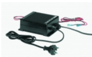
Преобразователь тока WAECO CoolPower MPS-35

Идеален для использования дома, в гостинице, кемпинге.