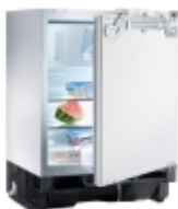
Автохолодильник WAECO CoolMatic HDC 155FF Компрессорный холодильник с морозильной камерой.

Все установочные комплекты разработаны для фактических моделей автомобилей.