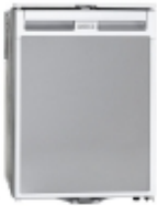
Автохолодильник WAECO CoolMatic CR 50 дверь слева. Автохолодильник WAECO CoolMatic CR 50, общ. 48л, вкл. 5л мороз. кам., цв. серый, дверь слева, пит. 12/24/220В

Все установочные комплекты разработаны для фактических моделей автомобилей.