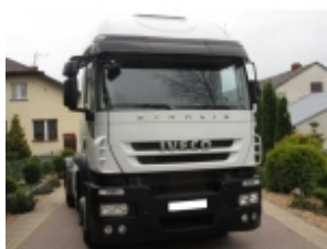
Комплект установки WAECO CoolAir RT880

Монтажная концепция кондиционеров CoolAir: простой и быстрый монтаж благодаря использованию собственных точек крепления автомобиля.