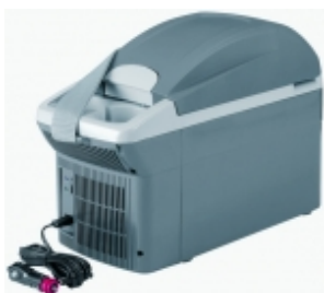
Термоэлектрический автохолодильник WAECO BordBar TB-08

Легкий удобный автомобильный холодильник. В комплекте есть ремень для ношения на плече, что делает холодильник более универсальным. Как и все термоэлектрические холодильники имеется режим ПОДОГРЕВ(до 65 градусов). Его по достоинству оценят молодые мамы, которым часто приходится в длительной дороге разогреть своим малышам детское питание, сок, чай и т.д. Так же специальные места под стаканы помогут вам налить напиток не пролив его.