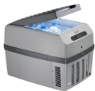
Автохолодильник WAECO TropiCool TCX-14 Ваесо (Ваеко) TropiCool TCX-14 – это небольшой мобильный холодильник с термоэлектрической системой, разработанный специально для легковых автомобилей. Камера модели имеет вместительность в 14 литров, и может сохранять холодными не только продукты, но и напитки. В качестве источника питания агрегат способен использовать сеть с разными напряжениями: 12/24/230 В.