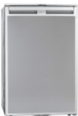
Автохолодильник WAECO CoolMatic CR 140 Компрессорный холодильник с отделкой под нержавеющую сталь с питанием 12/24 В пост. тока, 100–240 В пер. тока

Все установочные комплекты разработаны для фактических моделей автомобилей.