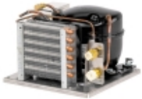
Хладоустановка WAECO ColdMachine 95

Профессиональная модель для холодильников очень большого объема и для использования в тропических водах.