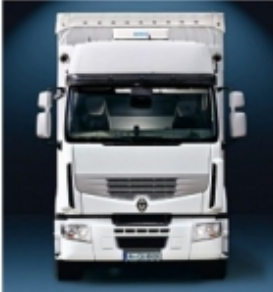
Комплект установки WAECO CoolAir RT880/850S/CoolAir SP-950 Монтажная концепция кондиционеров CoolAir: простой и быстрый монтаж благодаря использованию собственных точек крепления автомобиля.