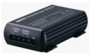
Конвертор напряжения WAECO PerfectPower DCDC 06

PerfectPower DCDC 12 - номинальный входной ток: 5А , номинальный выходной ток: 6А