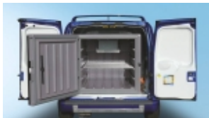
Холодильник WAECO CoolFreeze 850VAN Автохолодильник WAECO CoolFreeze 850VAN охл.

Все установочные комплекты разработаны для фактических моделей автомобилей.