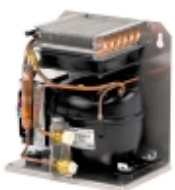
Хладоустановка WAECO ColdMachine 96

Профессиональная модель для холодильников очень большого объема и для использования в тропических водах.