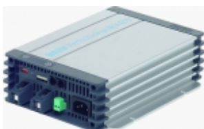
Зарядное устройство WAECO PerfectCharge MCA 2425

6-ступенчатое IU0U автоматическое зарядное устройство, 25 А.