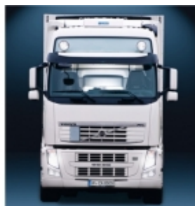
Комплект установки WAECO CoolAir RT880/850S

Монтажная концепция кондиционеров CoolAir: простой и быстрый монтаж благодаря использованию собственных точек крепления автомобиля.