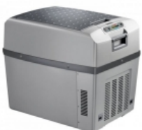
Термоэлектрический холодильник WAECO TropiCool TCX-35 Портативный автомобильный холодильник термоэлектрического типа с универсальным питанием 12/24В от автомобильного прикуривателя и 220В от розетки переменного тока работает не только на охлаждение, но и на нагрев. При этом конструкторами термоэлектрического холодильника достигнуты прекрасные параметры: он охлаждает на 30 градусов ниже температуры окружающей среды, и нагревает до 65 градусов.