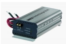
Зарядный конвертер и з/у для батарей WAECO PerfectCharge DC-40 Конвертор и зарядное устройство для аккумулятора WAECO PerfectCharge DC-40