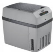
Автохолодильник WAECO TropiCool TCX-21 Термоэлектрический холодильник Waeco TropiCool TCX-21 со специальной электроникой ТС на 12/24 В пост. тока и 230 В перем. тока. Интеллектуальная цепь экономии энергии, динамическая вентиляция внутреннего отсека, износоустойчивые вентиляторы. Термоэлектрический холодильник Waeco TropiCool TCX-21 со специальной электроникой ТС на 12/24 В пост. тока и 230 В перем. тока. Интеллектуальная цепь экономии энергии, динамическая вентиляция внутреннего отсека, износоустойчивые вентиляторы.