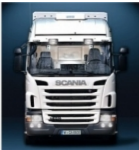
Комплект установки WAECO CoolAir RT880/850S/CoolAir SP-950 Монтажная концепция кондиционеров CoolAir: простой и быстрый монтаж благодаря использованию собственных точек крепления автомобиля.